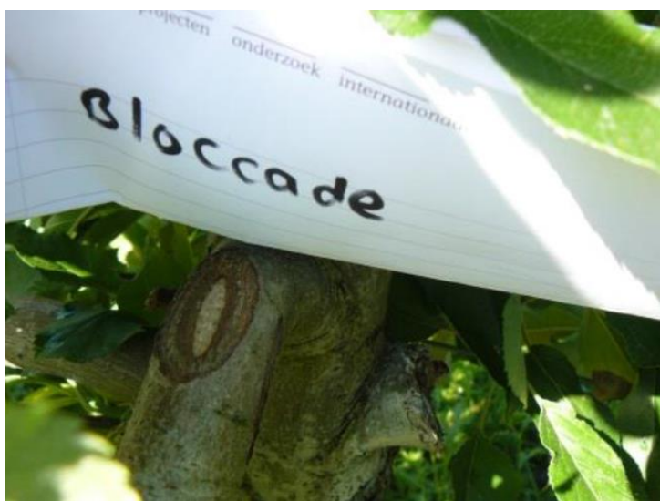
Foto. BlocCade geeft een mooi wondherstel en verlaagt de kans op infectie tot slechts 7%.