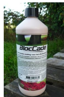
Foto. BlocCade is verkrijgbaar in een 1, 5 en 10 liter verpakking.